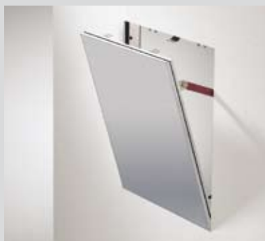
Пожарозащита – стена