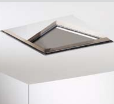
Свободно носещ таван F30 D131