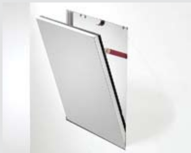
Херметичност и защита от прах – стени