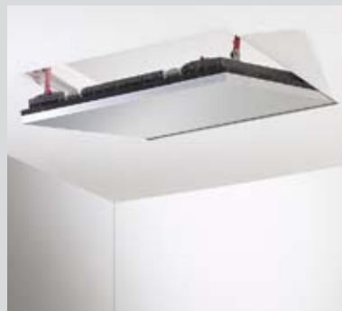
Свободно обтегнат таван F90 K219

Особено, когато Кнауф Alutor® ревизионни клапи са необходими в голямо количество, планирането на големи обекти става по-лесно. Те спестяват време и средства и освен това постигат максимална сигурност за пожарозащита.