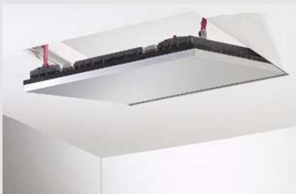
Кнауф Alutop® F-TEC таван