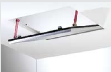
Херметичност и защита от прах – таван