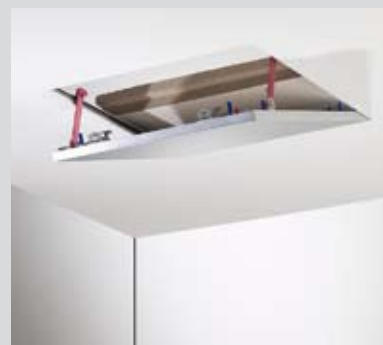
Пожарозащита – таван