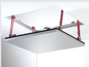
Устойчивост на дезинфициращи средства - таван