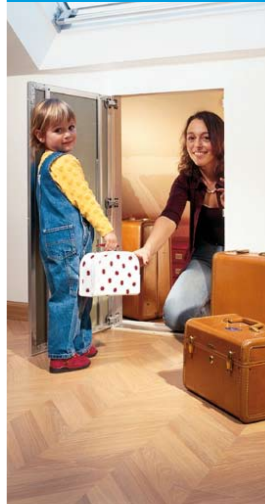
Knauf Alutop® ревизионна клапа Дремпел

Безпроблемен достъп и до ограничените дремпелни помещения на таванските етажи? Knauf Alutop® ревизионна клапа “Дремпел” всъщност представлява една врата оборудвана със шарнири от страни. До една максимална дебелина на обшивката на тавана от 25mm ревизионната клапа Дремпел може да се намери в стандартизирани размери. За по-големи входове има двукрили варианти.