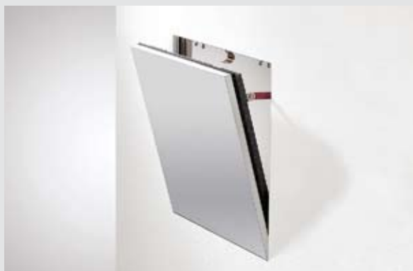
Кнауф Alutop® F-TEC шахтова стена