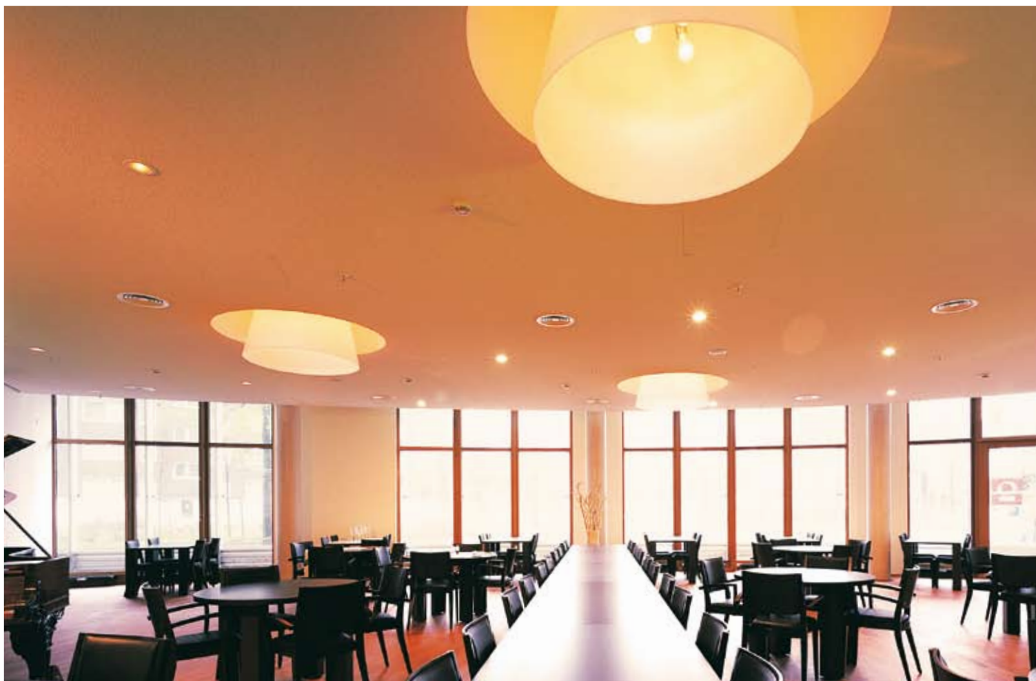
Форум Новерис в Дюселдорф