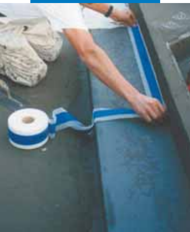
Пример за хидроизолиране с Mapeband на ъгъл между основа и вана