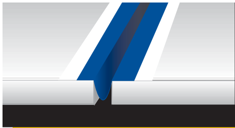
Поставяне на Mapeband в дилатационна фуга