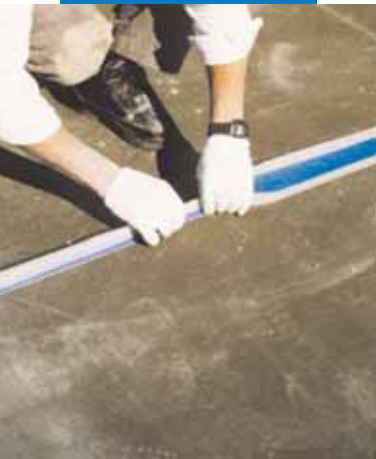
Пример за хидроизолация на структурно съединение на тераса